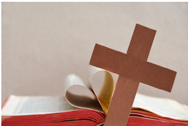
N. Schwarz © GemeindebriefDruckerei.de