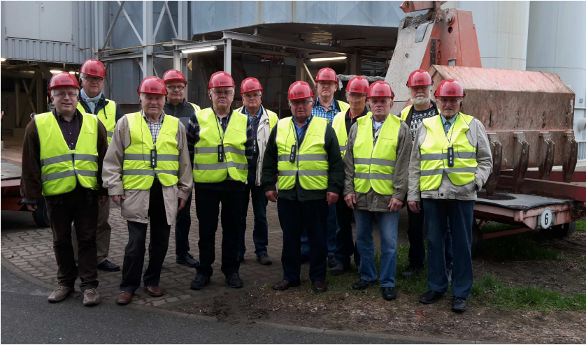
Der Männerkreis besichtigt die MVA Hannover