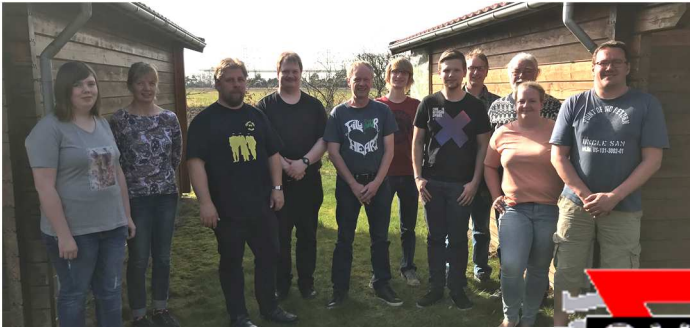
Der neue CVJM Vorstand